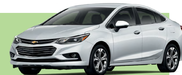
Cuadro 1. Municipios y alcaldías con más vehículos asegurados robados con violencia.

En el cuadro 1 se muestran los 15 municipios o alcaldías con mayor número de vehículos asegurados robados con violencia.