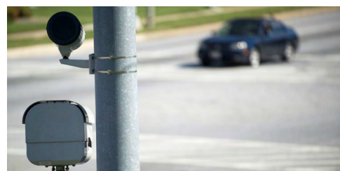
Cuadro 1. Sanciones aplicables en el sistema Fotocívicas